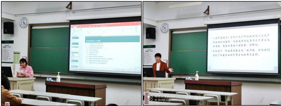
图2 马克思主义学习分享